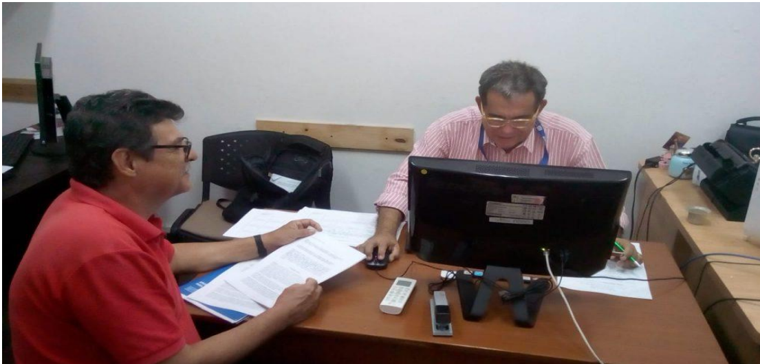
Atención y Asesoría a Usuario elaboración de Derecho de Petición a la Unidad de Víctimas