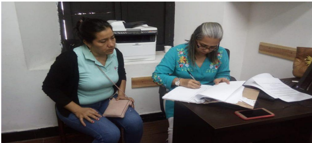
Asistencia a la Mesa de Participación de Víctimas de Girón -MPVG

Carrera 25 No. 29-19 Tel. 646 6805 Girón - Santander personeria@giron-santander.gov.co